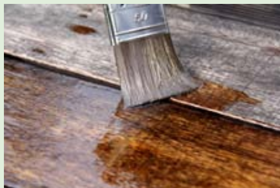
B09, Mahoń Szlachetny B13 lub inne propozycje marki VIDARON.

Dobierając bejcę w sklepie, zwróć uwagę na to, czy jest odporna na promieniowanie UV i nadaje się do zastosowania na zewnątrz budynków. Informacja powinna znajdować się na opakowaniu oraz w karcie technicznej produktu. Najlepiej sięgnąć po sprawdzoną Bejcę do Drewna VIDARON, która jest polecana do zastosowania zarówno wewnątrz, jak i na zewnątrz budynków. Można pomalować nią na przykład meble ogrodowe wykonane z jasnego drewna sosnowego, tak aby nadać im ciemniejszy kolor. Wykorzystaj bejcę do drewna na zewnątrz i zyskaj piękne wykończenie – wybierz kolor Orzech Amerykański